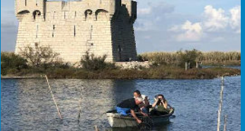
Avec les pêcheurs de Palavas