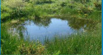
Mare dans la Montagne Noire