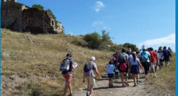
Sur le chemin des "Jardins de Marie"