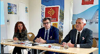
Bilan Aéroport Perpignan