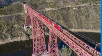
Réouverture de la ligne de l'Aubrac