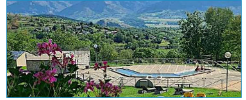
Projet : mise en conformité des bains de Dorres (66)

Cet Appel à projets, lancé en mars dernier, a pour objectif, en lien avec le Pacte vert et le Schéma Régional de Développement du Tourisme et des Loisirs, d'engager et d'accompagner la transformation des activités touristiques, pour favoriser un tourisme durable, responsable et solidaire. Il doit également permettre de soutenir le développement d'un tourisme authentique, la diversification et la montée en gamme de l'offre touristique, d'expérimenter de nouvelles dynamiques économiques locales, en lien avec les habitants, de poursuivre le développement 4 saisons des stations de montagne, du littoral et thermales, ainsi que de développer un tourisme plus inclusif. Les élus régionaux viennent de voter le financement de 47 projets retenus dans le cadre de cet Appel à projets pour un montant de 6 M€ (dont 1,4 M€ d'avances remboursables).