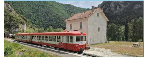
Projet : aménagement paysager Gare St-Martin-Lys (11)