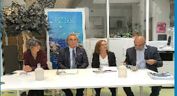
Bilan Archipel de THau