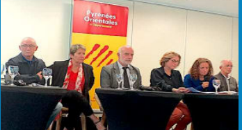
Bilan ADT 66