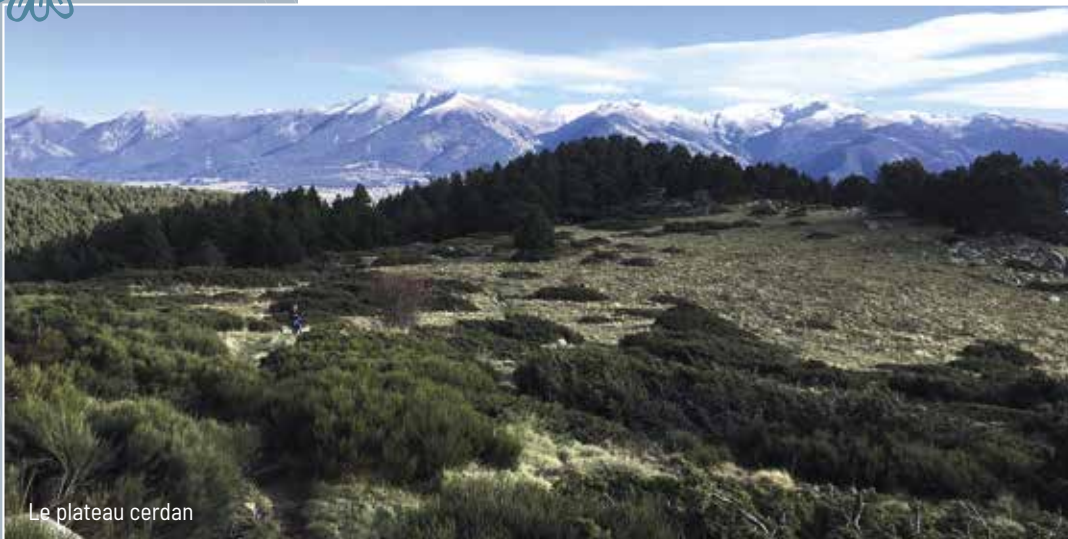
Le plateau cerdan

Agrémenté d'une source à mi-parcours et de nombreux framboisiers l'été, le large sentier file à flanc de montagne parmi les genêts fleuris à partir de la mi-juin et se termine en pente douce à la Croix, découvrant le long de son parcours le splendide paysage du plateau cerdan, aux sommets tardivement enneigés. Les marmottes laissent entendre leur sifflement, et à l'aube ou au crépuscule, le marcheur silencieux peut y surprendre biches et chevreuils (attention aux tiques des genêts cependant).